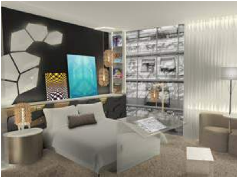
La Senses ROOM Studio - Hall 8 Espace B 61