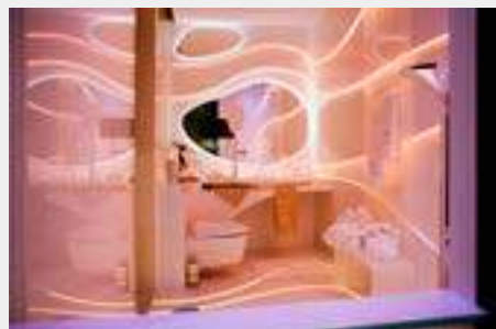
Les Partenaires de la Senses ROOM. P.6