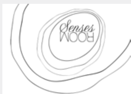
La Senses ROOM Studio P.3